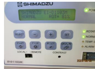
ノーマル切り替わり時操作盤